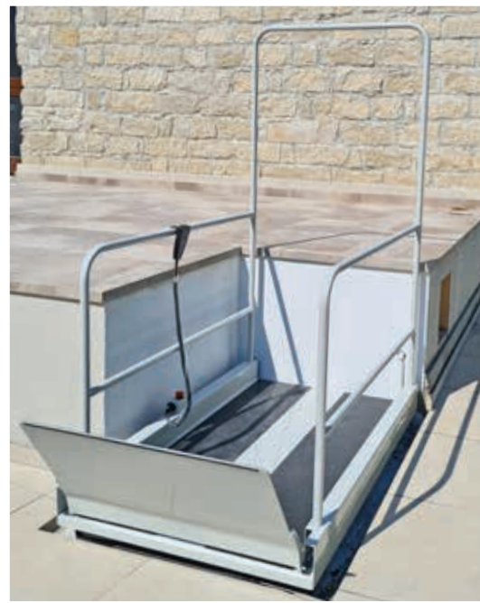
Installations extérieures pour une utilisation temporaire ou permanente

Le garde-corps optionnelle à l'arrêt supérieur sert de protection contre les chutes