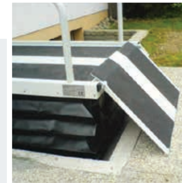
Optionnel: Rampe d'accès manuelle se replie vers le bas lors du levage