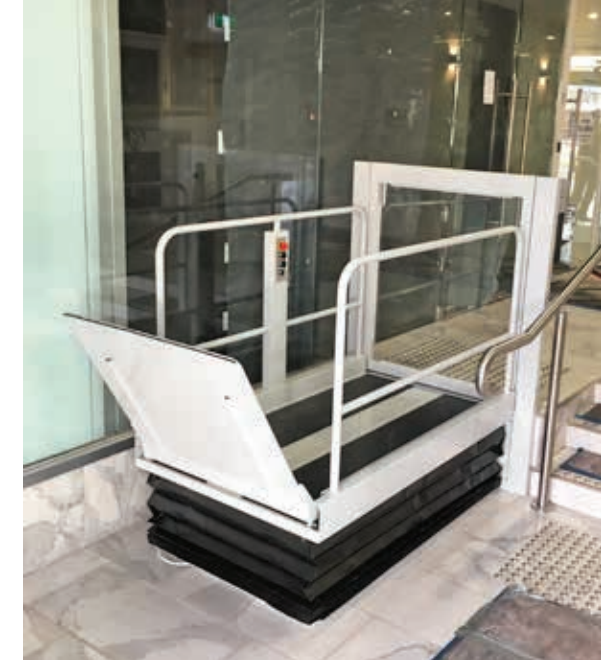
Version avec porte à l'arrêt supérieur, barrières plus haute et poteau pour boîtier commande