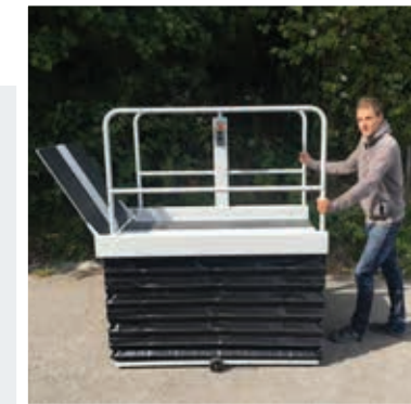
Optionnel: Roues pour déplacement idéales pour différents lieux d'utilisation