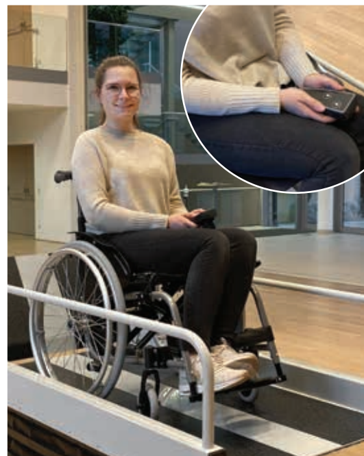
La télécommande avec un câble en spirale permet de contrôler facilement la plateforme